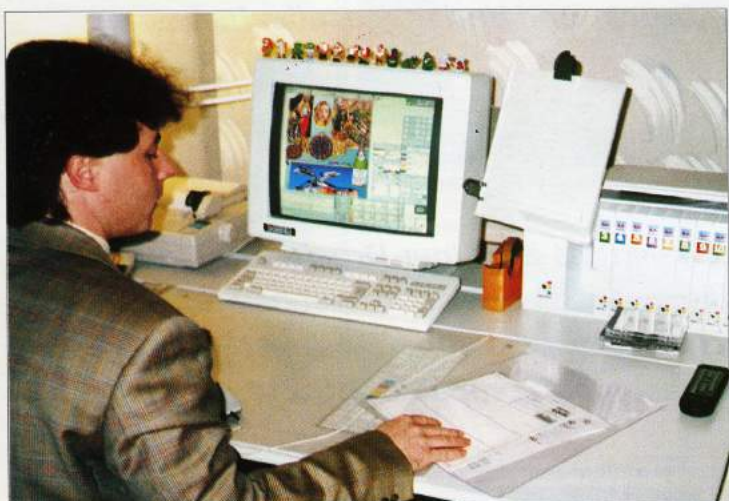
Wenige Monate vor der EBV-Installation hat Kolbl einen ehemaligen Crosfield-Mitarbeiter mit Studio-Erfahrung angestellt.