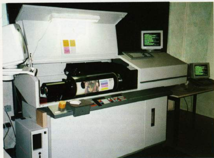
Ein zweiter Magnascan 656 wurde bereits im Vorjahr installiert.