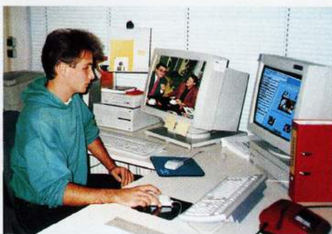
DTP-Anbindung mit Studioliink 9.

Da der zweite Magnascan 656 (Eingabe/Ausgabe) bereits im Vorjahr angeschafft wurde, ging es bei der jetzigen Studio-Installation, inklusive DTP-Anbindung und Glasfaseroptik-Netzwerk GALAN, um weniger als die jährlichen Kosten in der Handmontage, in denen die Materialkosten – Montagefolien, Ulano, Tageslichtfilme usw. – nicht berücksichtigt sind.